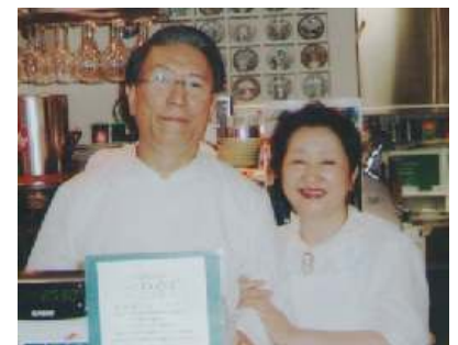
永いことありがとうございました

このたび、Tavola Ganba 亭の廃業閉店を決断しました。 1972 年南 3 西 3 サンスリービルにオープンスパゲティ Ganba 亭、 つづいて南 3 西 4 シルバービル。そして Tavola Ganba 亭と 39 年間 多くのお客様、業者の方たち、メディアの方たちに支えられてここまで やってこられました。永年のご厚情に感謝し御礼をもうしあげます。 私たちも四捨五入すると 70 歳であります。いつかは到来するこの日です が残りの人生を楽しむエネルギーが残っているうちにと 10 年ほど 前より 65 歳を目標としていました。しかし、後継者を育成するのに 2 年を要しようやくここにいたって決断いたしました。