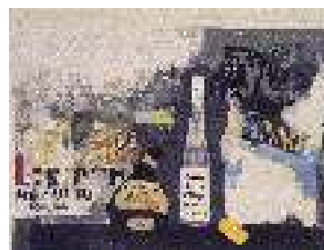
原画は Tavola Ganba 亭所有