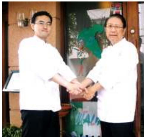
若い世代にバトンタッチ

1978年8月 札幌市西区生れ 1998年3月 北海道中央調理師専門学校卒業 1998年4月 Tavola Ganba 亭入社